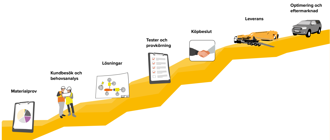
Norditeks försäljningsprocess, kallad Norditektrappan

Norditeks finansiella mål är en organisk omsättnings-tillväxt om 15 procent per år, en EBITA-marginal på över 17 procent och en nettoskuldssättning understigande 3 gånger EBITDA.