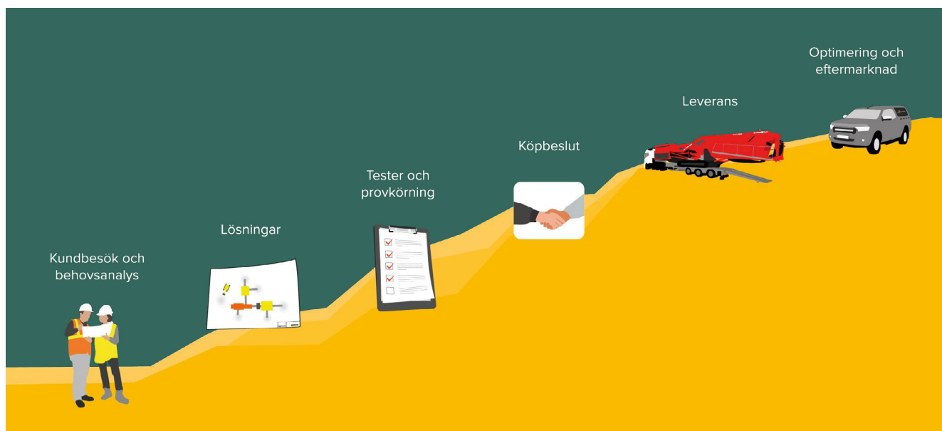
Norditeks försäljningsprocess, kallad Norditektrappan

Norditeks finansiella mål är en organisk omsättnings-tillväxt om 15 procent per år, en EBITA-marginal på över 17 procent och en nettoskuldssättning understigande 3 gånger EBITDA.