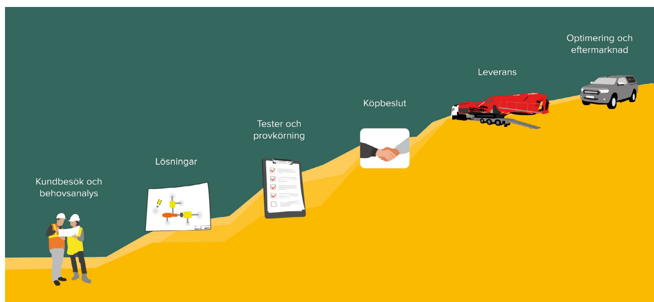
Norditeks försäljningsprocess, kallad Norditektrappan

Norditeks finansiella mål är en organisk omsättnings-tillväxt om 15 procent per år, en EBITA-marginal på över 17 procent och en nettoskuldssättning understigande 3 gånger EBITDA.