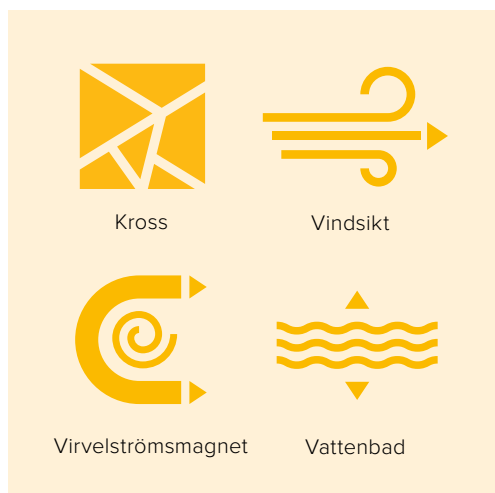
Exempel på moduler i Norditeks modulsystem

Norditeks mobila återvinningsanläggningar bygger alla på samma modulsystem. Detta möjliggör att fler tekniker kan användas för en mer detaljerad sortering av kundens material. Tack vare att modulsystemet kan hantera de olika teknikerna samtidigt så är det möjligt att lösa fler problem inom återvinningsområdet. En ökad återvinningsgrad ger ökade vinster för kunden samtidigt som kunden bidrar till ett mer cirkulärt samhälle.